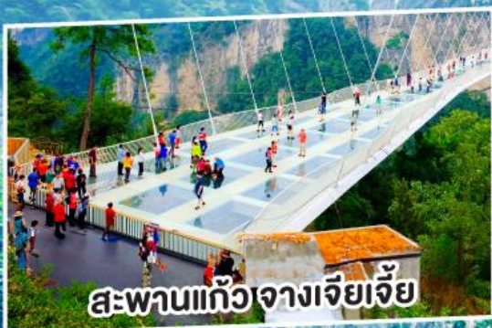
สะพานแก้วจางเจียเจีย

คุ้มครองสูงสุด 3 ล้านบาท ** มีเงื่อนไขไม่ตามเงื่อนไขกำหนด ความคุ้มครองเป็นไปตามกรมธรรม์ประกันภัย