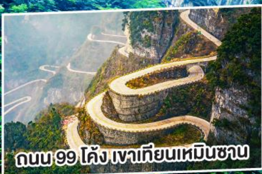
ถนน 99 โค้ง เมาเทียนเหมินซาน