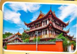
วัดเหวินชู่