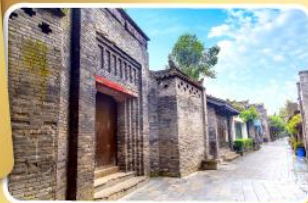
ถนนโบราณชอยกวางชอยแคบ