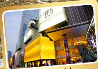
ถนนชุนชี่ลู่