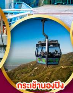
กระเช้านองปิง