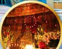
แม่กวนอิมฮ่องฮ่า