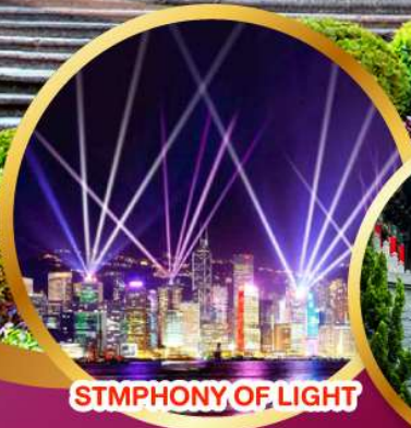
STMPHONY OF LIGHT