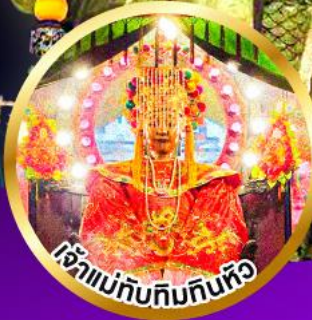
เจ้าแม่ทับทิมกินหัว