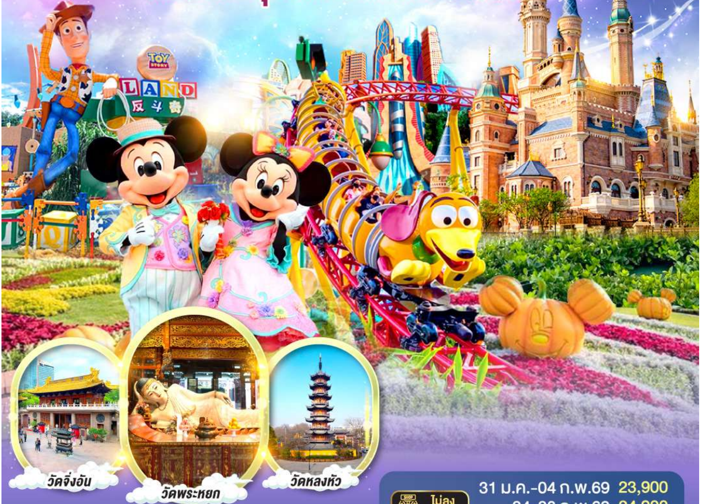
วัดจิ้งอัน