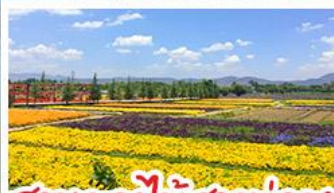
สวนดอกไม้ฮัวมู่ฉาง