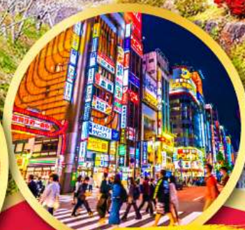
ช้อปปิ้ง ย่านชินจูกุ