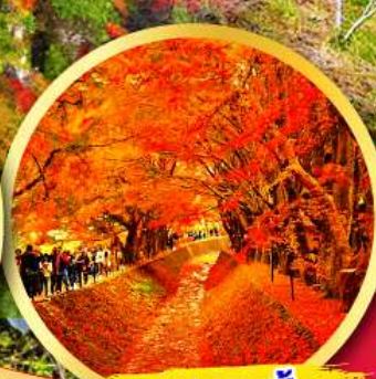
อุโมงค์ใบเมเปิ้ล โมมิจิ โคโร