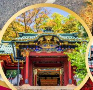
ศาลเจ้าโทโฮคุ