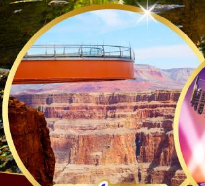
แกรนด์แคนยอน Sky walk