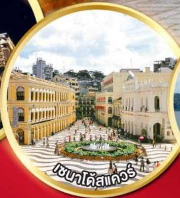
เวเนทียาแมคเก๊า