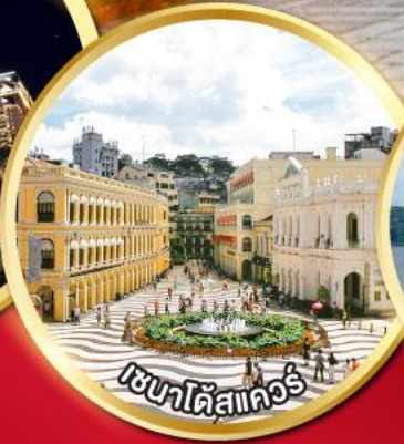
เวเนตัสแควอร์