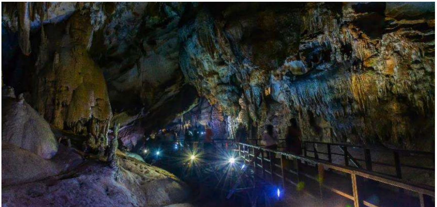
GO1HAN-VJ101 GO VIETNAM เรือดนามเหนือ ฮานอย ซาปา ฟานซีปัน ฮาลอง 5วัน 4คืน โดยสารการบิน Vietjet Air (VJ)

ระหว่างล่องเรือเที่ยวชม ถ้ำสวรรค์ หรือ “ถ้ำนางฟ้า” ชมหินงอกหินย้อยแห่งอ่าวฮาลองที่มีอายุนับล้านปี มีโครงสร้างสลับซับซ้อนกันหลายชั้นพร้อมประดับไฟไว้อย่างสวยงาม ภายในถ้ำจะเห็นได้ว่าหินงอกหินย้อยต่าง ๆ นั้นจะมีลักษณะรูปร่างแตกต่างกันออกไป ตามแต่ท่านจะจินตนาการ ขึ้นอยู่ว่าแต่ละท่านจะตีความออกมาว่าเป็นรูปร่างเหมือนสิ่งใดในถ้ำเราจะเห็นหินรูปร่างฟ้าที่ถูกสร้างขึ้นมาจากทางธรรมชาติที่ติดอยู่ภายในผนังถ้ำ นับว่าเป็นสิ่งมหัศจรรย์อย่างหนึ่งและมีตำนานเล่าขานกันว่า มีเหล่านางฟ้าเข้ามาอาบน้ำในถ้ำแห่งนี้และเกิดหลงไหลชายหนุ่มผู้ที่เป็นมนุษย์เลยคิดที่จะไม่ยอมกลับไปสวรรค์ จนกระทั่งเวลาผ่านไปกลุ่มนางฟ้าทั้งหลายเลยกลายเป็นหินติดอยู่ที่ผนังถ้ำอย่างน่าอัศจรรย์.