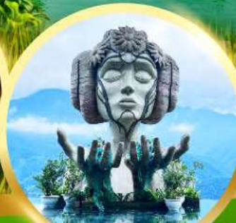
โมนาน่า ซาปา คาเฟ่