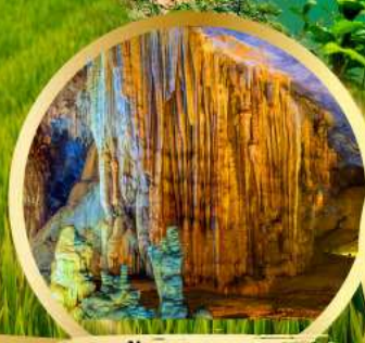
ถ้ำสวรรค์