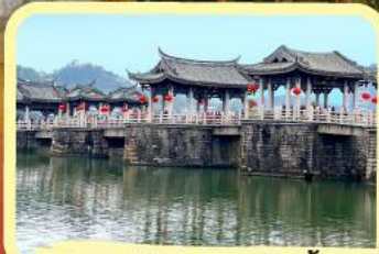
• สะพานโบราณกว่างจี้