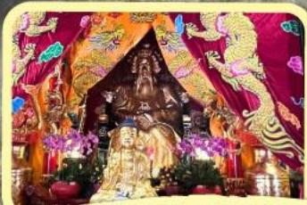
• เอียงบู๊ซิว (ศาลเจ้าพ่อเสือ)