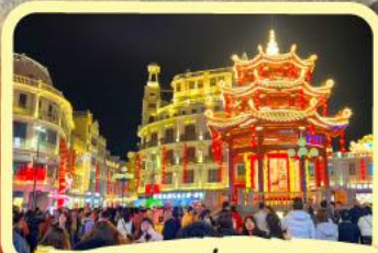
• ถนนโบราณเสี่ยวกงหยวน