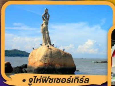
• จูไห่พีชเชอร์เก็ทส์