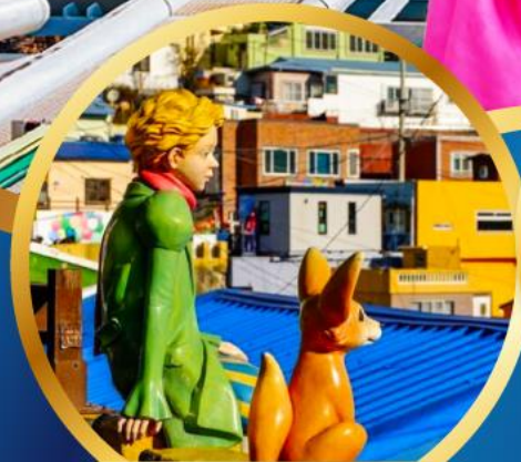
หมู่บ้านวัฒนธรรมคิมซอน