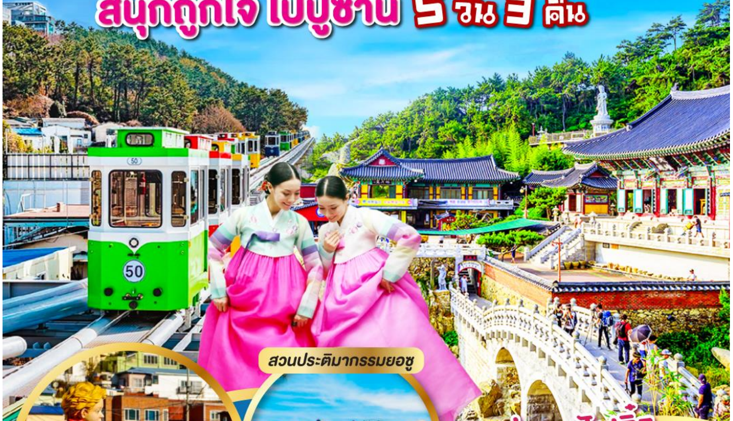
สวนประติมากรรมยอซู