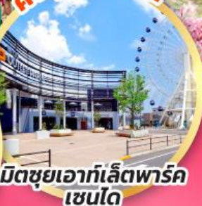
มิตซูเอากะไลท์พาร์ค เซนได