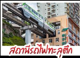
สถานีรถไฟทะเลซุติ๊ก

ดงชิง - อุโมงค์ - หงหยาดัง อุทยานเทานางฟ้างชิง สถานีรถไฟทะเลซุติ๊ก หลุมฟ้าสามสะพานสวรรค์