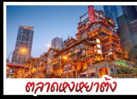
ตลาดแดงเซาตัง