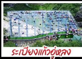
ระเบียงแก้วอุโมงค์