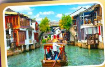
ล่องเรือเมืองโบราณซูโจวเจียเจียว