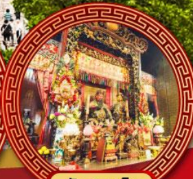
วัดกวนโถ