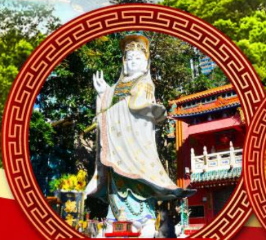
เจ้าแม่กวนอิมหาดริ์ฟส์ลีย์