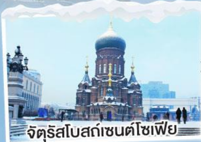
จัตุรัสโบสถ์เซนต์โซเฟีย