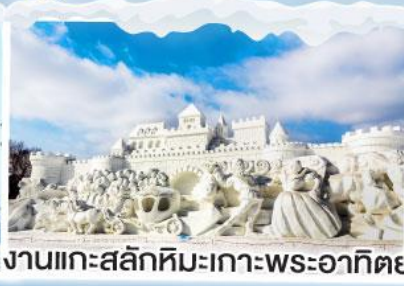
งานแกะสลักหิมะเกาะพระอาทิตย์

• งานเทศกาลแกะสลักหิมะที่ใหญ่ที่สุดในโลก HARBIN ICE & SNOW FESTIVAL 2025