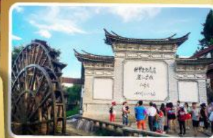
เมืองท่าลี่เจียง