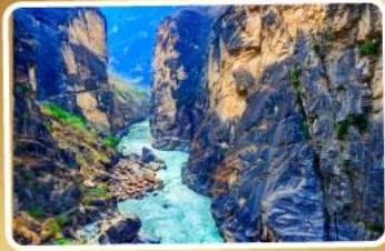
ช่องแคบเสือกกระโจน