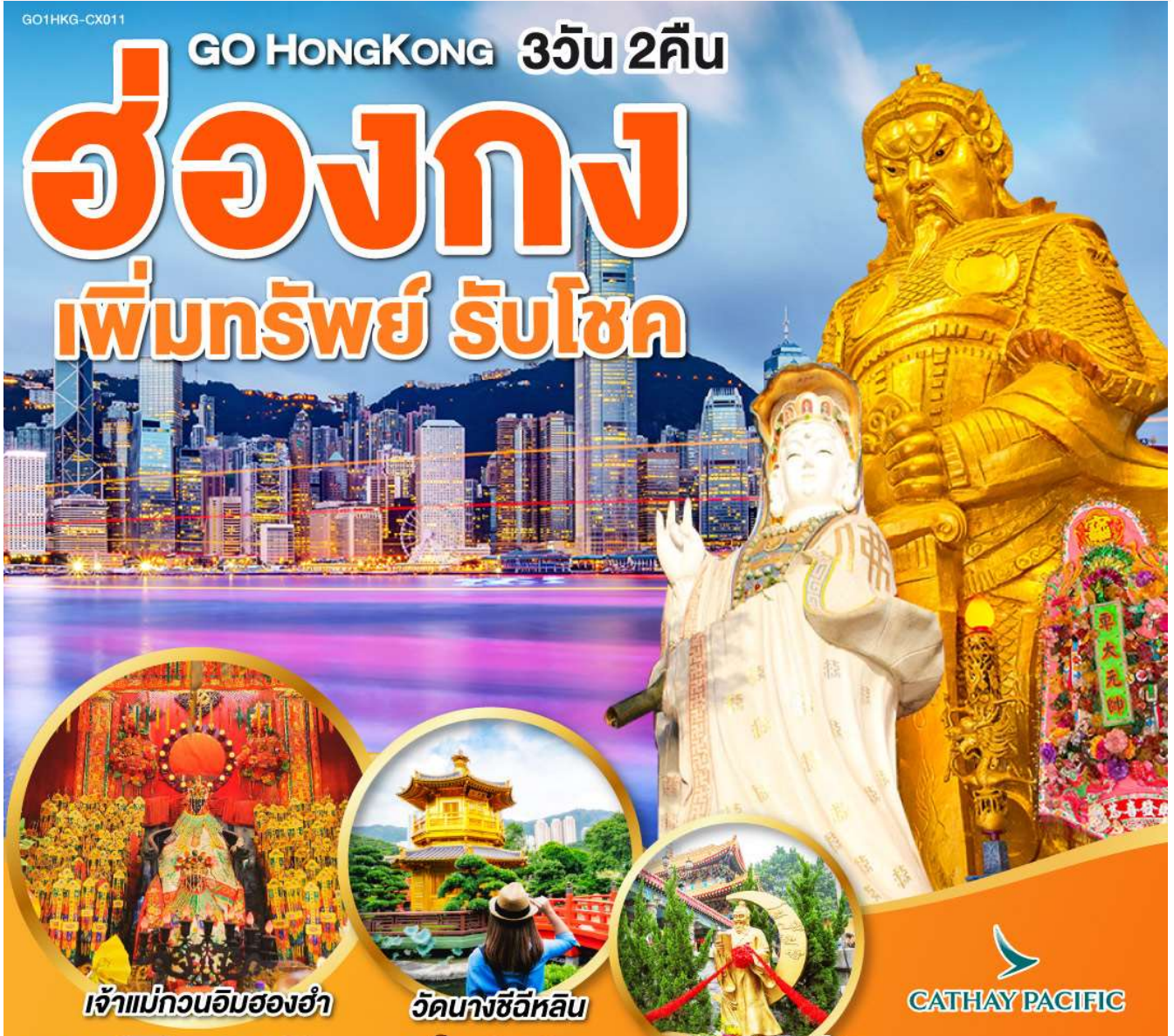
เจ้าแม่กวนอิมสองอ่า