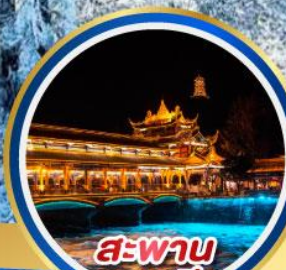
สะพาน หนานเจียว