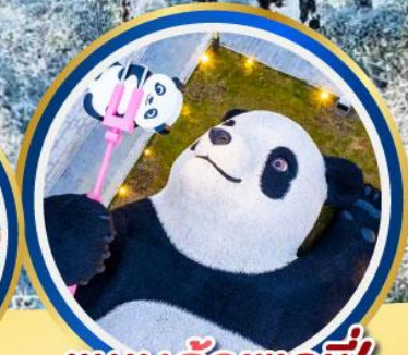
แพนด้าเชลฟี