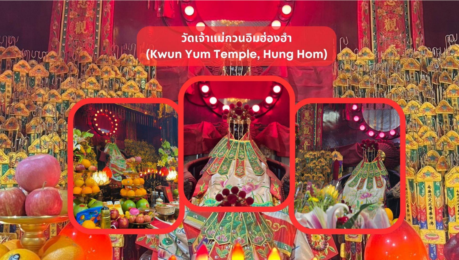
วัดเจ้าแม่กวนอิมฮ่องกง (Kwun Yum Temple, Hung Hom)

รับประทานอาหารเช้า ณ ภัตตาคาร บริการท่านด้วยเมนูติ่มซำฮ่องกง (มื้อที่ 2)