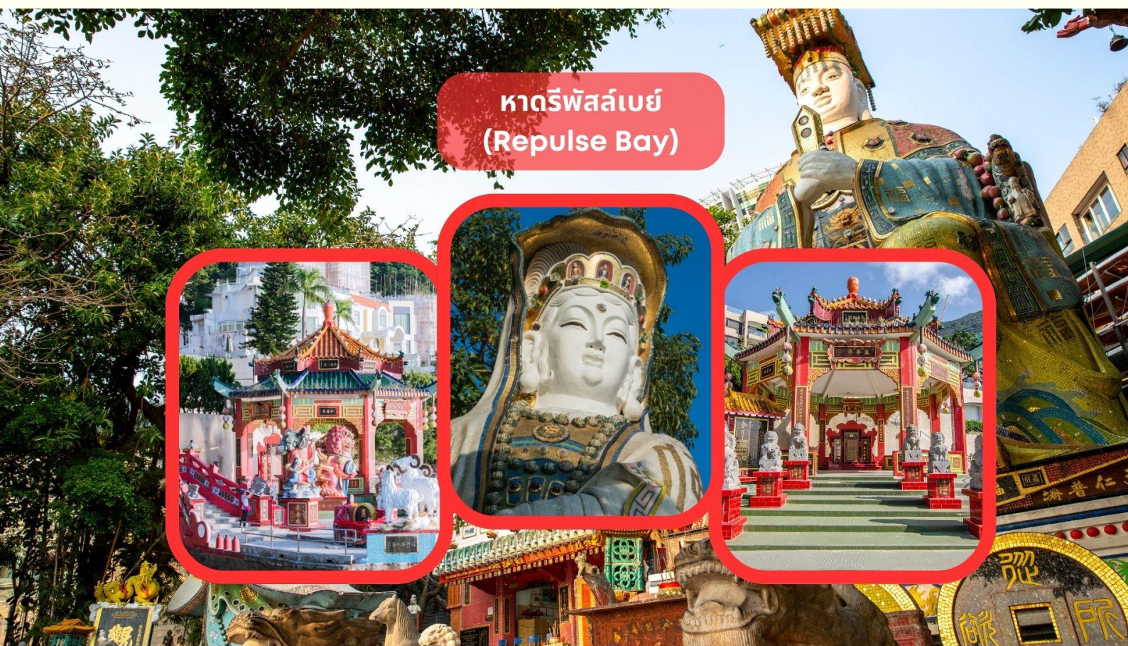
หาดรีพัลส์เบย์ (Repulse Bay)

หมายเหตุ : เนื่องจากตัวเครื่องบินของคณะเป็นตัวสุ่มระบบ Random ไม่สามารถล็อกที่นั่งได้ ที่นั่งอาจจะไม่ได้นั่งติดกันและไม่สามารถเลือกช่วงที่นั่งบนเครื่องบินได้ในคณะ ซึ่งเป็นไปตามเงื่อนไขสายการบิน