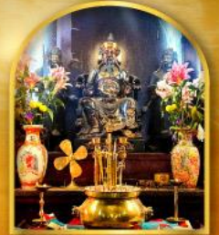
วัดปึกโต