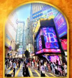
ช้อปปิ้งจุใจย่านจิมซาจุ่ย