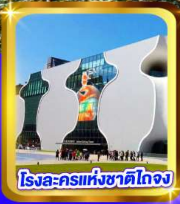
โรจระครแห่งชาติไถจง