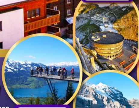
ยอดเขา ฮาร์เตอร์คูลม