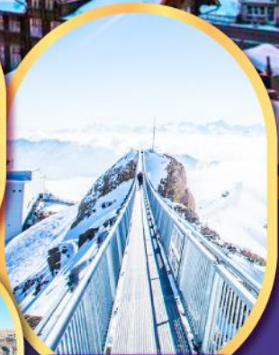
ยอดเขา กลาเซียร์ 3000