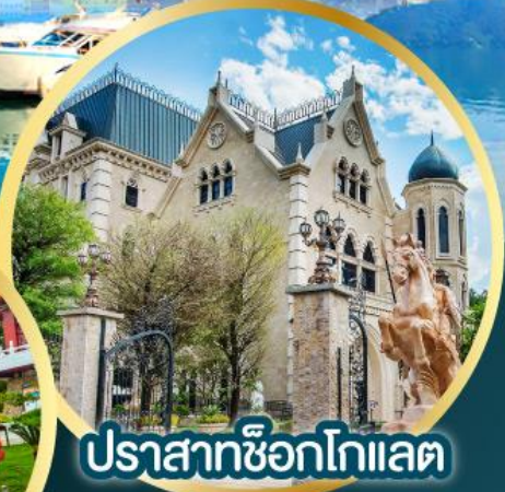
ปราสาทช็อกโกแลต