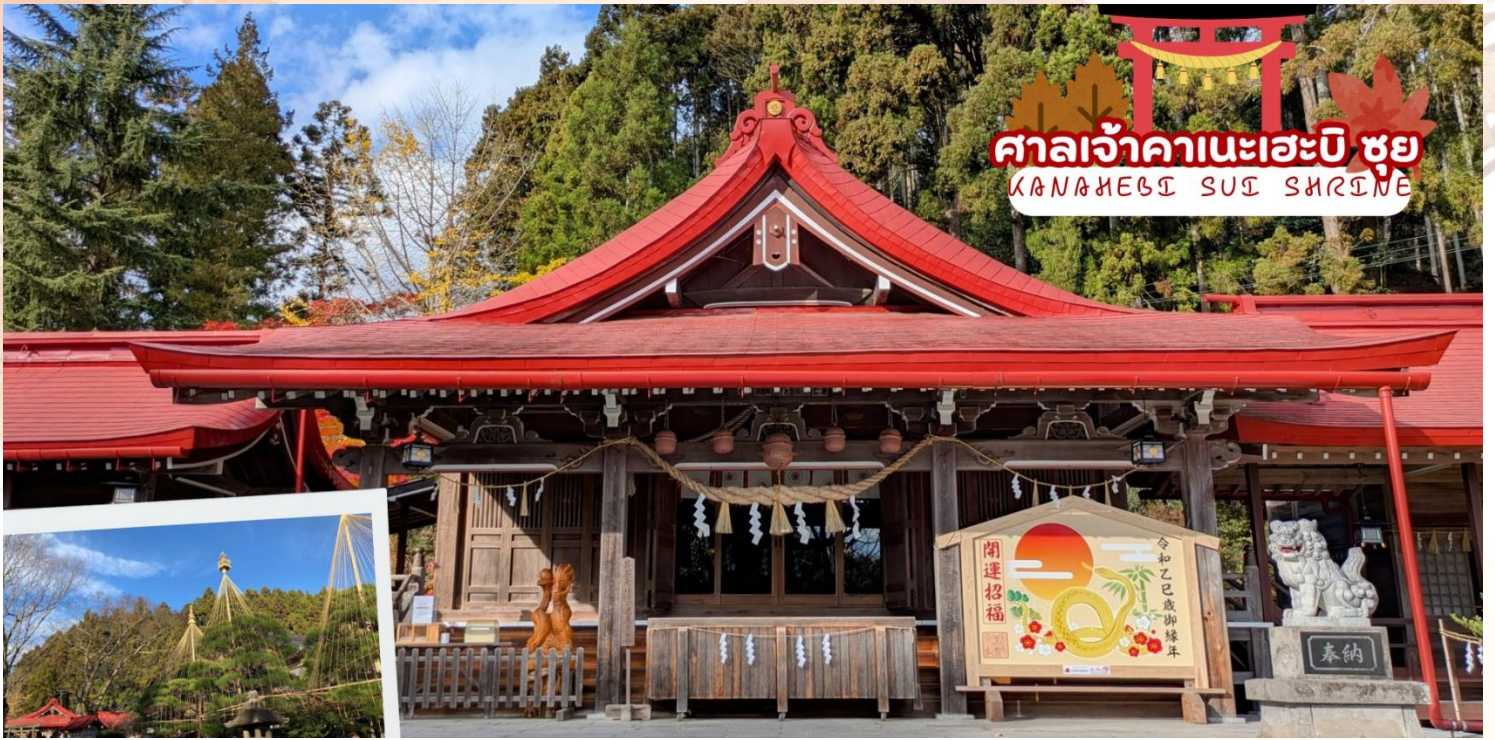
ศาลเจ้าคานะเอะจิ ชูย KANAMEJI SUYU SHRINE

กลางวัน รับประทานอาหารกลางวัน ณ ร้านอาหาร (มื้อที่ 6)