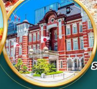
รถไฟ JR TOHOKU SHINKANSEN