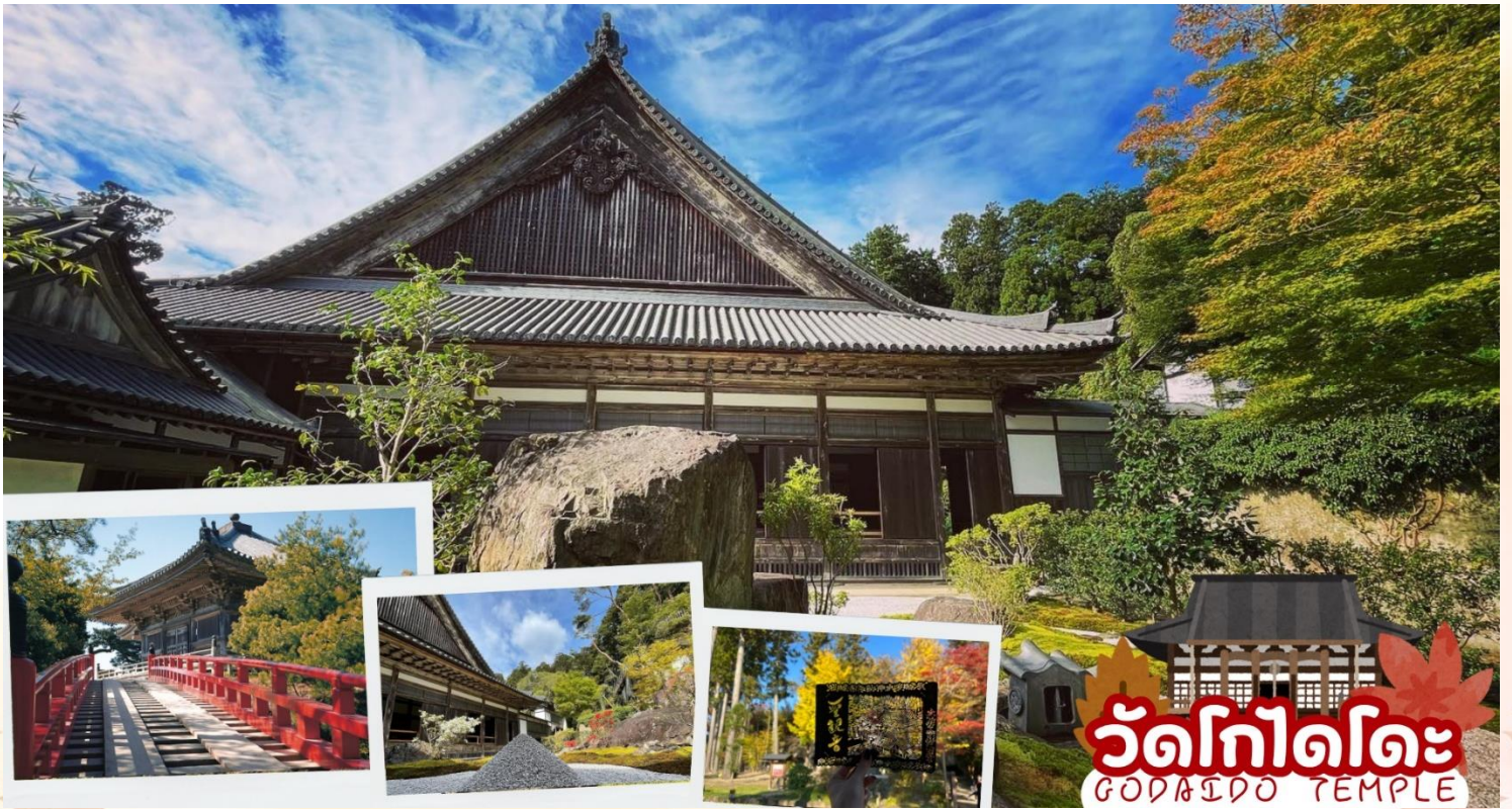
วัดโกไดโดะ GODAIDO TEMPLE

กลางวัน รับประทานอาหารกลางวัน ณ ร้านอาหาร (มื้อที่ 6)