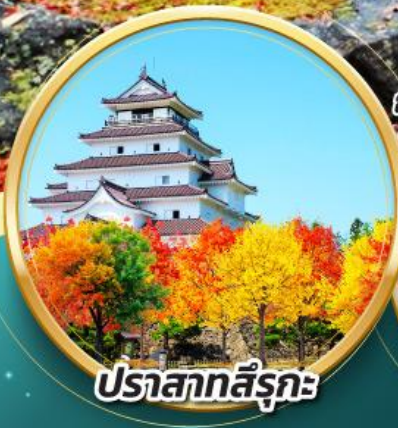
ปราสาทสิโรกะ