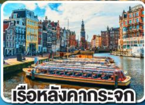
เรือหลังคากระจก