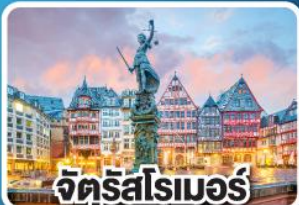
จัตุรัสโรเมอร์