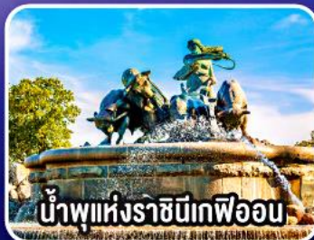
น้ำพุแห่งราชินีเกฟิออน