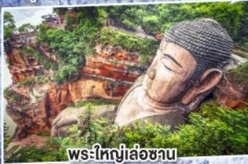
พระใหญ่เล่อซาน