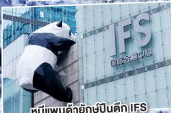
หมีแพนด้ายักษ์ปีนตึก IFS