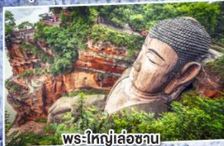
พระใหญ่เล่อซาน