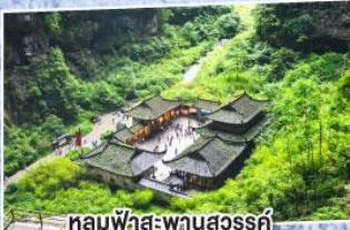
หลุมฟ้าสะพานสวรรค์