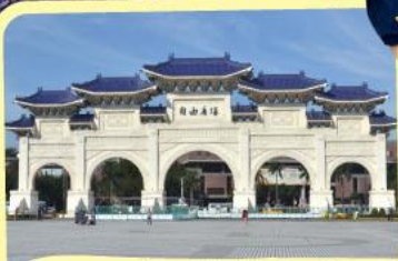
• อุสุรณสถานเจียงไคเช็ค