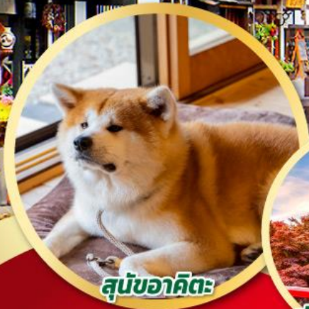
สุนัขอาคิตะ