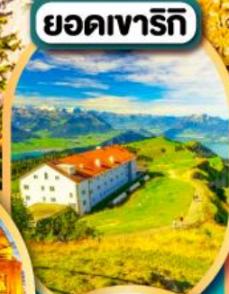
ยอดเขารีกี