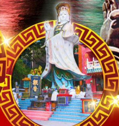
เจ้าแม่กวนอิม ทาดร์พีส์ลีย์

เมนูสุด พิเศษ!! ต้มข้าวฮ่องกง บุฟเฟ่ต์ชาบูสโตร์ฮ่องกง, ห่านย่าง