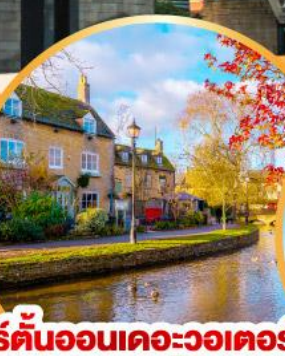
เบอร์ตันออนเดอะวอเตอร์