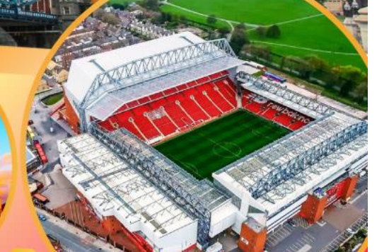
เข้าชมสนามฟุตบอลแอนฟิลด์

เมนูสุดพิเศษ!! Fish & Chips อาหารไทย และ ภัตตาคารดัง Four Season