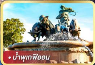
• น้ำพุเทพีออน