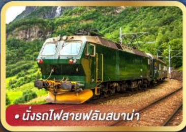
• นั้งรถไฟสายฟลั้มสบาน่า