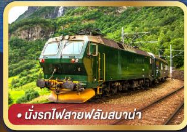
• นั้งรถไฟสายฟลัมสบาน่า