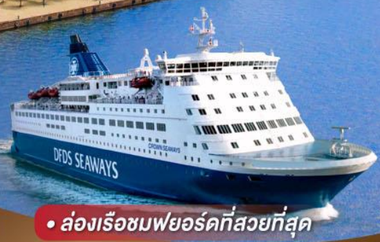
• ล่องเรือชมพยอร์ดที่สวยงามที่สุด