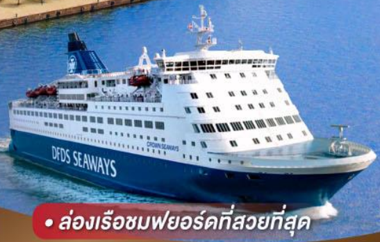
• ล่องเรือชมพยอร์ดที่สวยงามที่สุด