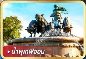
• น้ำพุเทโพออน